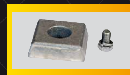
Ánodo de sacrificio opcional